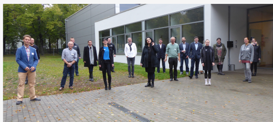
Teilnehmerinnen und Teilnehmer des Termins

Am 15. Oktober 2020 fand in Leipzig das erste Vernetzungstreffen der Koordinatoren der ASSKomm-Kommunen im Raum Leipzig und der PiT-Steuergruppe des Landkreises Leipzig statt. Zu dem Treffen waren weiterhin die Coaches der betreffenden Kommunen und ein Vertreter des Fachdienstes Prävention der Polizeidirektion Leipzig geladen.