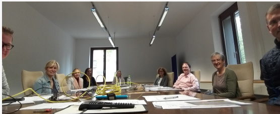
AG Frühkindliche und schulische Prävention

Am 7. Oktober 2020 tagte die Arbeitsgruppe »Frühkindliche und schulische Prävention« und widmete sich mit Blick auf alle Regionen in Sachsen ihrem Auftrag der Ressourcenbündelung vieler Präventionsangebote für die Zielgruppe Kinder und Jugendliche.